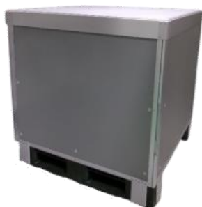
ダンサーモテスト結果

※ダンサーモの手配・回収については、距離・地域により料金が異なるためTRANCOMにお問い合わせください。