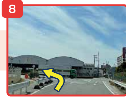
正面に「福山通運」が見えてきます。