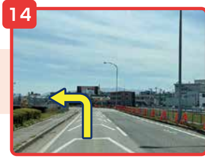
直進しカーブを曲がると左手に貨物地区入口の看板が見えてきます。