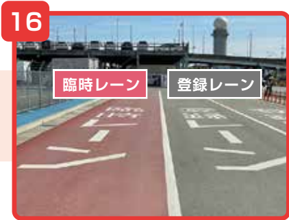
「臨時レーン」と「登録レーン」に分かれています。該当するレーンに進んでください。