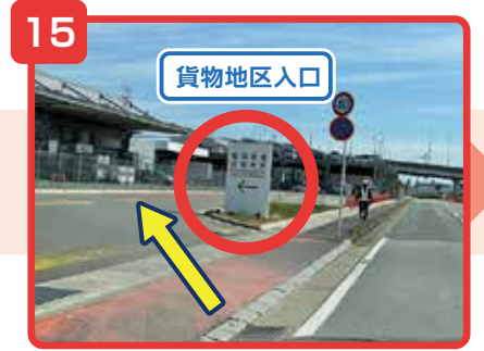
貨物地区入口の看板から入ります。