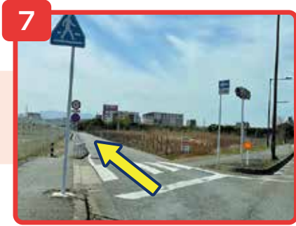
左折後そのまま直進してください。