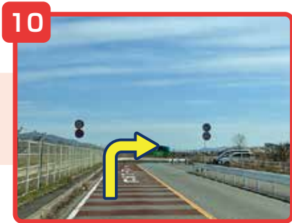
そのまま直進してください。