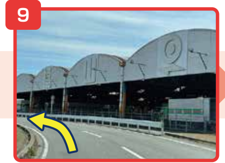
そのまま直進してください。