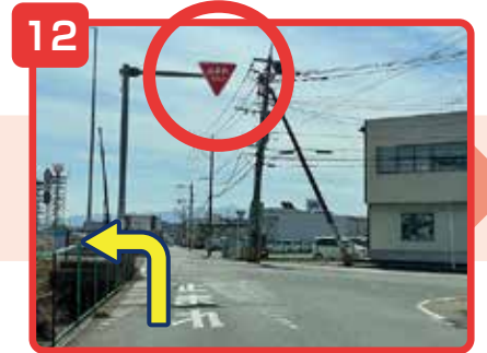
止まれるの標識の所で左折してください。