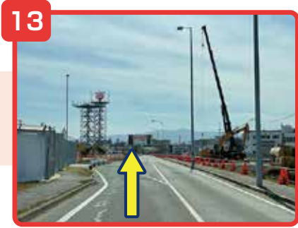
左折後そのまま直進してください。