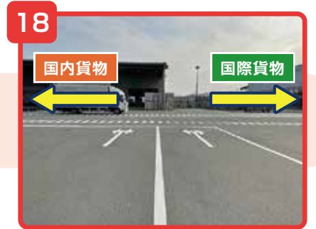
貨物地区入口を通過後、右が国際貨物事務所、左が国内貨物事務所になります。

※貨物地区立入許可書をお持ちの方は「登録レーン」、お持ちでない方は「臨時レーン」に進んでください。