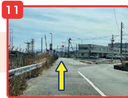
そのまま直進してください。