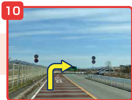
そのまま直進してください。