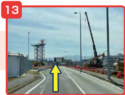
左折後そのまま直進してください。