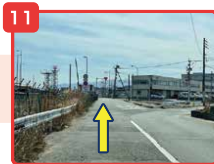
そのまま直進してください。