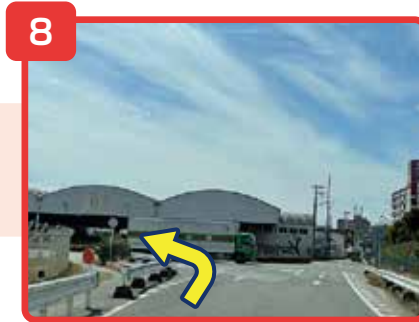
正面に「福山通運」が見えてきます。