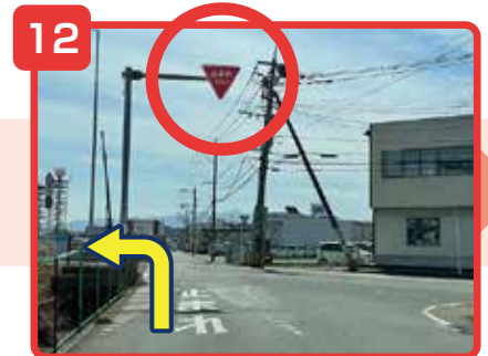
止まれるの標識の所で左折してください。