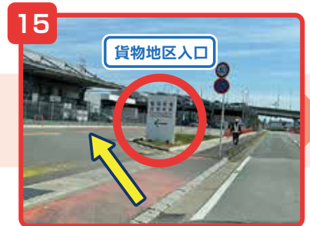
貨物地区入口の看板から入ります。