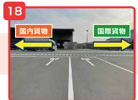
貨物地区入口を通過後、右が国際貨物事務所、左が国内貨物事務所になります。

※貨物地区立入許可書をお持ちの方は「登録レーン」、お持ちでない方は「臨時レーン」に進んでください。