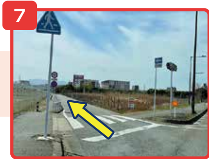
左折後そのまま直進してください。