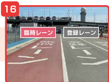
「臨時レーン」と「登録レーン」に分かれています。該当するレーンに進んでください。