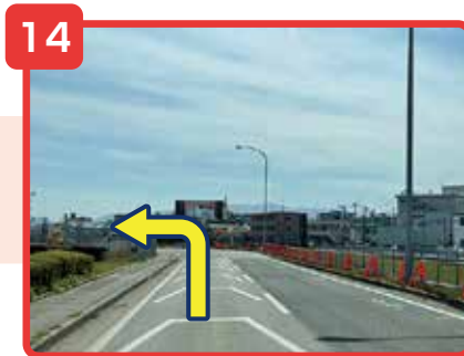
直進しカーブを曲がると左手に貨物地区入口の看板が見えてきます。