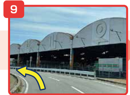
そのまま直進してください。