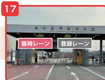
貨物地区入口をご通過の際は身分証明書のご提示をお願い致します。