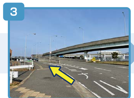
左車線の貨物ターミナル方面に進んでください。