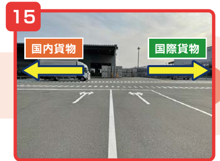
貨物地区入口を通過後、右が国際貨物事務所、左が国内貨物事務所になります。

※貨物地区立入許可書をお持ちの方は「登録レーン」、お持ちでない方は「臨時レーン」に進んでください。