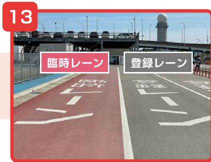
「臨時レーン」と「登録レーン」に分かれています。該当するレーンに進んでください。