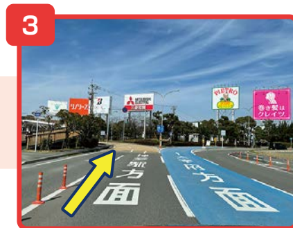
博多駅方面に直進します。