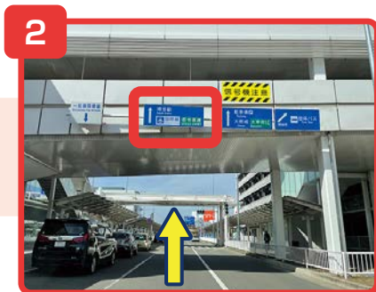
博多駅方面に直進します。