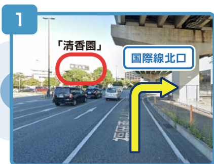
福岡南バイパスを直進し「国際線北口」の交差点を右折します。