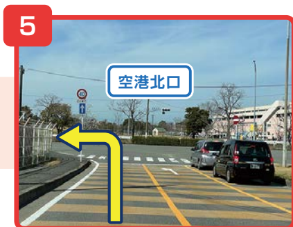
「空港北口」の交差点を左折します。