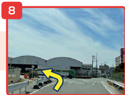
正面に「福山通運」が見えてきます。