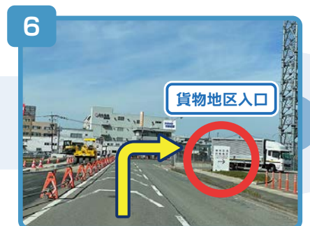
貨物地区入口の看板が右手に見えてきます。

※貨物地区入口よりお進みいただいた後、<国内線側からお車でお越しの場合>の13～15に沿ってお進みください。