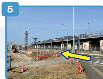
左折後、そのまま進んでください。