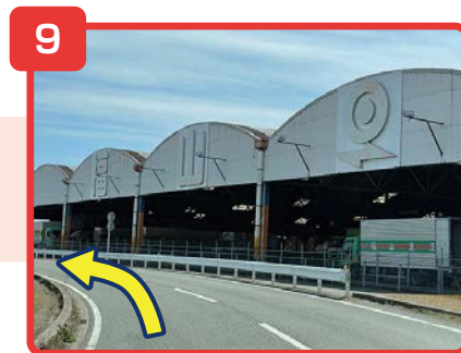
そのまま直進してください。