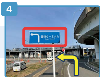
貨物ターミナルの看板が見えてきます。突き当りを左折します。