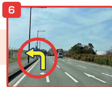
左車線を直進し左折します。