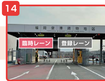
貨物地区入口をご通過の際は身分証明書のご提示をお願い致します。