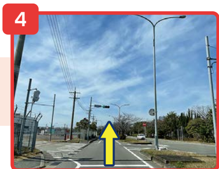
そのまま直進してください。