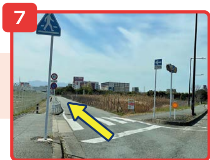
左折後そのまま直進してください。