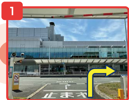
国内線ターミナルの立体駐車場を出て右に進みます。