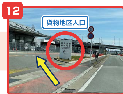
貨物地区入口の看板から入ります。