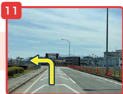
直進しカーブを曲がると左手に貨物地区入口の看板が見えてきます。