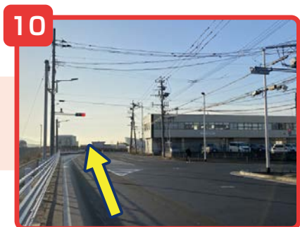
道なりに行くと交差点が見えますので、直進してください。